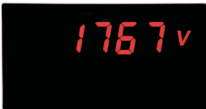
PAXLITE in Originalgröße

PAXLITE-Geräte werden im Maschinen- und Anlagenbau, in der chemischen Industrie, der Kunststoffindustrie, der Nahrungsmittelindustrie, der Verpackungs- und Fördertechnik und in vielen anderen Bereichen eingesetzt und helfen dort bei der Automatisierung und Vereinfachung von Arbeitsprozessen. Alle physikalischen Größen, die von einem Meßwertempfänger erfasst werden, der einen Ausgang für mA, mV, VDC, VAC, ADC oder AAC bereitstellt, können skaliert und in der gewünschten physikalischen Einheit angezeigt werden.