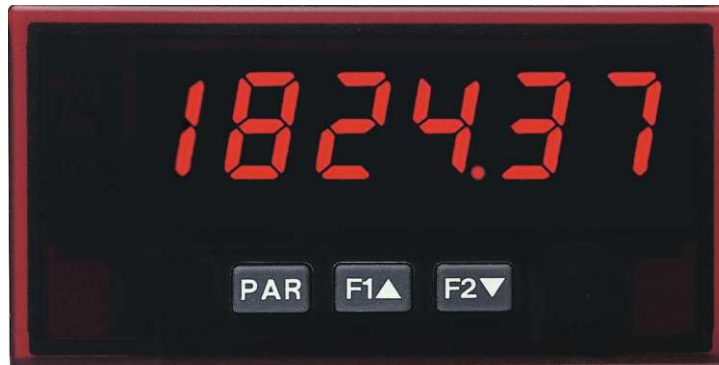
PAX LR in Originalgröße

Den Industrie - Tachometer PAX LR kann man natürlich auch als sehr flexibles und genaues Laborgerät einsetzen. Er wurde aber mit dem robusten Kunststoffgehäuse und der hohen Schutzart IP 65 für den rauen Industrieinsatz konzipiert. Die weltweit eingesetzte, ausgereifte und auf Langlebigkeit ausgelegte Elektronik erhält vor Auslieferung einen 3 Tage langen Qualitätstest unter Vollast. Das Gerät wird direkt über 3 Tasten schnell und sicher projektiert.