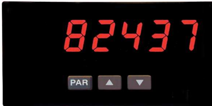
PAX LPT in Originalgröße

Die Industrie -Prozessanzeige PAXLPT kann natürlich auch als sehr flexibles und genaues Laborgerät eingesetzt werden. Sie wurde aber mit dem robusten Kunststoffgehäuse und der hohen Schutzart IP 65 für den rauen Industrieinsatz konzipiert. Die weltweit eingesetzte, ausgereifte und auf Langlebigkeit ausgelegte Elektronik erhält vor Auslieferung einen 3 Tage langen Qualitätstest unter Vollast. Das Gerät wird direkt über 3 Tasten schnell und sicher projiziert. Es steht eine 6-stellige Anzeige für die Dezimaldarstellung von Std./Min./Sek. Oder eine 5-stellige Anzeige als Chronometer zur Verfügung. Durch die Möglichkeit eines aktivierbaren gleitenden Mittelwertes können Störungen herausgefiltert und die Anzeige werden.