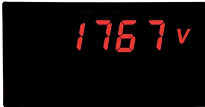
PAXLITE in Originalgröße

PAXLITE-Geräte werden im Maschinen- und Anlagenbau, in der chemischen Industrie, der Kunststoffindustrie, der Nahrungsmittelindustrie, der Verpackungs- und Fördertechnik und in vielen anderen Bereichen eingesetzt und helfen dort bei der Automatisierung und Vereinfachung von Arbeitsprozessen. Hohe Spannungen bis 600 VAC können skaliert und in der gewünschten physikalischen Einheit angezeigt werden.