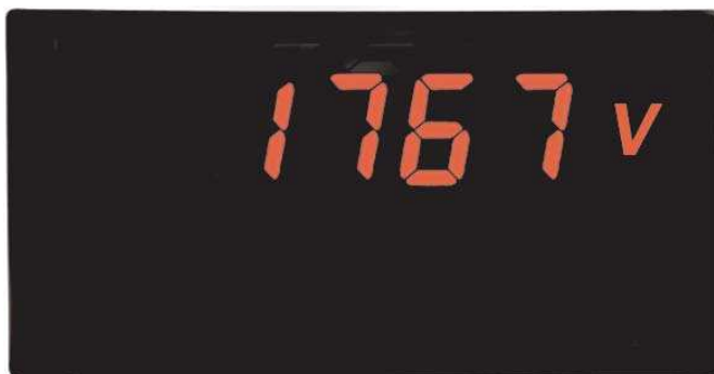
PAXLITE in Originalgröße

PAXLITE-Geräte werden im Maschinen- und Anlagenbau, in der chemischen Industrie, der Kunststoffindustrie, der Nahrungsmittelindustrie, der Verpackungs- und Fördertechnik und in vielen anderen Bereichen eingesetzt und helfen dort bei der Automatisierung und Vereinfachung von Arbeitsprozessen. Alle physikalischen Größen, die von einem Meßwertempfänger erfasst werden, der einen Ausgang für 0/4-20 mA, 10-50 mA oder 0-5 VDC bereitstellt, können skaliert und in der gewünschten physikalischen Einheit angezeigt werden.