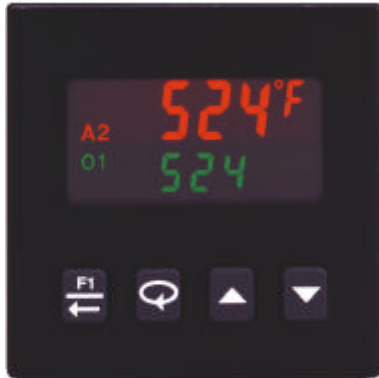
T16 in Originalgröße

Dieser kleine Temperatur-/Prozessregler ist ein Alleskönner. Mit einem neu entwickelten Thermo-ASIC ausgerüstet, werden moderne Programmier- Bedien- und Kontrolltechnologien in einem für den rauen industriellen Einsatz konzipierten Gehäuse realisiert. Alles wurde dafür getan, damit der T16 schnell in Betrieb genommen, einfach und sicher bedient werden kann und seine Aufgabe jahrelang effizient ausführt. Schließlich sorgt eine überlegene Funktionalität für die einfache Anpassung an alle erdenklichen Regelaufgaben.