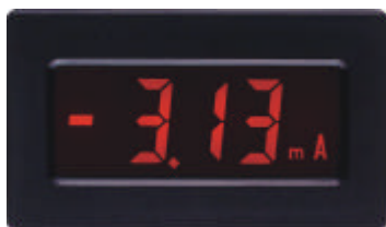
MDMV in Originalgröße

Das Voltmetermodul MDMV ist sowohl für den Einbau in eine Schalttafel, als auch für die Platinenmontage erhältlich. Durch einen automatischen Nullpunktgleich entfällt die manuelle Abgleichung des Nullpunktes. Der Eingangsbereich beträgt \pm 200 mVDC. Ein Über- bzw. Unterschreiten des Bereichs wird im Display angezeigt. Das MDMV verfügt über 5 Zusatzeinblendungen, die unabhängig voneinander einblendend werden können: BAT, V, A, m, \mu . Die hohe Genauigkeit, geringen Abmessungen und sehr einfache Installation machen das MDMV zu einer interessanten Alternative zu vielen herkömmlichen analogen Meßgeräten.