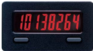
CUB 7T in Originalgröße

Der CUB 7T erfaßt die Betriebszeit von Maschinen und Anlagen. Die Ansteuerung erfolgt je nach Ausführung über einen Schaltkontakt oder eine angelegte Spannung. Ist der Zähler aktiv, blinkt ein Indikator in der Anzeige. Der CU 7T verfügt über 10 verschiedene Zeitbereiche, die über die Fronttasten eingestellt werden. Eine Rückstellung ist über die Fronttaste und einen externen Eingang möglich.