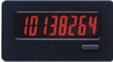
CUB 7P in Originalgröße

Der CUB 7P ist ein programmierbarer Impulszähler, dessen Ansteuerung je nach Ausführung über einen Schaltkontakt, über Spannungsimpulse von 10 bis 300 V oder Logikpegel erfolgen kann. Ein Skalierfaktor von 0.0001 bis 1.9999 und ein einstellbarer Dezimalpunkt ermöglichen eine individuelle Anpassung an die jeweilige Zähltaufgabe. Rückgestellt werden kann die Anzeige über die Fronttaste und einen externen Eingang.