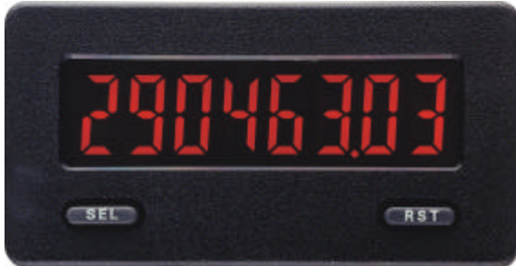
CUB 5 in Originalgröße

Der CUB5 ist eine preiswerte Anzeige für 2 Zählwerte und eine Geschwindigkeit. Er kann z.B. als Positions-, Drehzahl-, Stückzahl-, Geschwindigkeits- oder Durchfluß-Anzeige verwendet werden und läßt sich durch seine einfache Programmierung sofort in Betrieb nehmen.