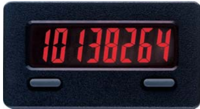
CUB 7C in Originalgröße ( mit roter Hinterleuchtung )