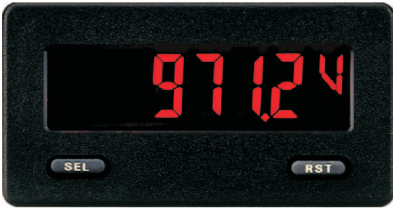
CUB5PB00 in Originalgröße

Der CUB5P ist eine preiswerte Digitalanzeige für Prozesssignale und wurde für den rauen Industriebetrieb entwickelt. Die Anzeige ist als Standard-LCD oder rot/grün hintergrundbeleuchtet lieferbar. Durch die freie Skalierung, den Minimal- und Maximalwertspeicher, die konfigurierbare Einheit und die optionale Aufrüstung mit bis zu 2 Schaltausgängen und serieller Schnittstelle besitzt der CUB5P ein sehr gutes Preis-/Leistungsverhältnis.