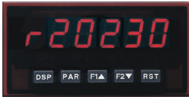
PAX R in Originalgröße

Den Industrie - Tachometer PAX R kann man natürlich auch als sehr flexibles und genaues Laborgerät einsetzen. Er wurde aber mit dem robusten Kunststoffgehäuse und der hohen Schutzart IP 65 für den rauen Industrieinsatz konzipiert. Die weltweit eingesetzte, ausgereifte und auf Langlebigkeit ausgelegte Elektronik erhält vor Auslieferung einen 3 Tage langen Qualitätstest unter Vollast. Das Gerät wird direkt über 5 Tasten schnell und sicher projektiert. Der Bediener freut sich über die übersichtliche Bedienoberfläche, mit der er einfach alle Parameter auf einen Blick erfassen und leicht verändern kann. Mit der steckbaren Grenzwertkarte kann er auch nachträglich aufgerüstet werden.